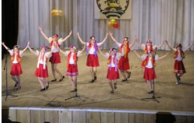
Танцевальный коллектив «Умырзая»