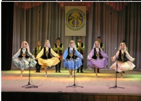
Танцевальный коллектив «Сияние»