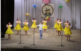
Танцевальный коллектив «Сияние»