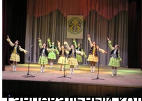
Танцевальный коллектив «Гульдар»